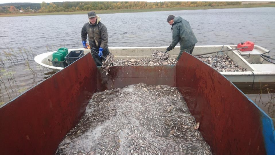
Reduktionsfiske i Skråmträsk.