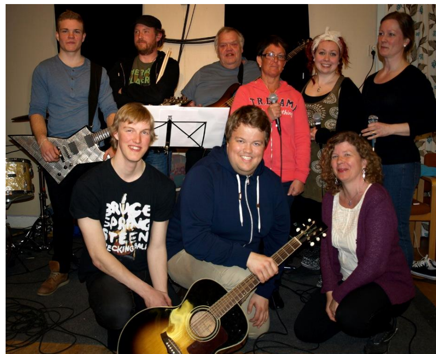
Strawberry Jam, bandet som ska spela på försommarfesten.