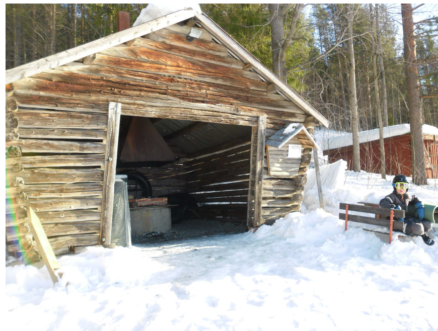
Grillstugan i Liabacken, februari 2015.