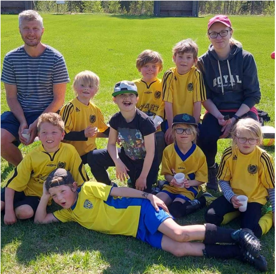
IFK Bjurfors ungdomslag vid hemmapremiären